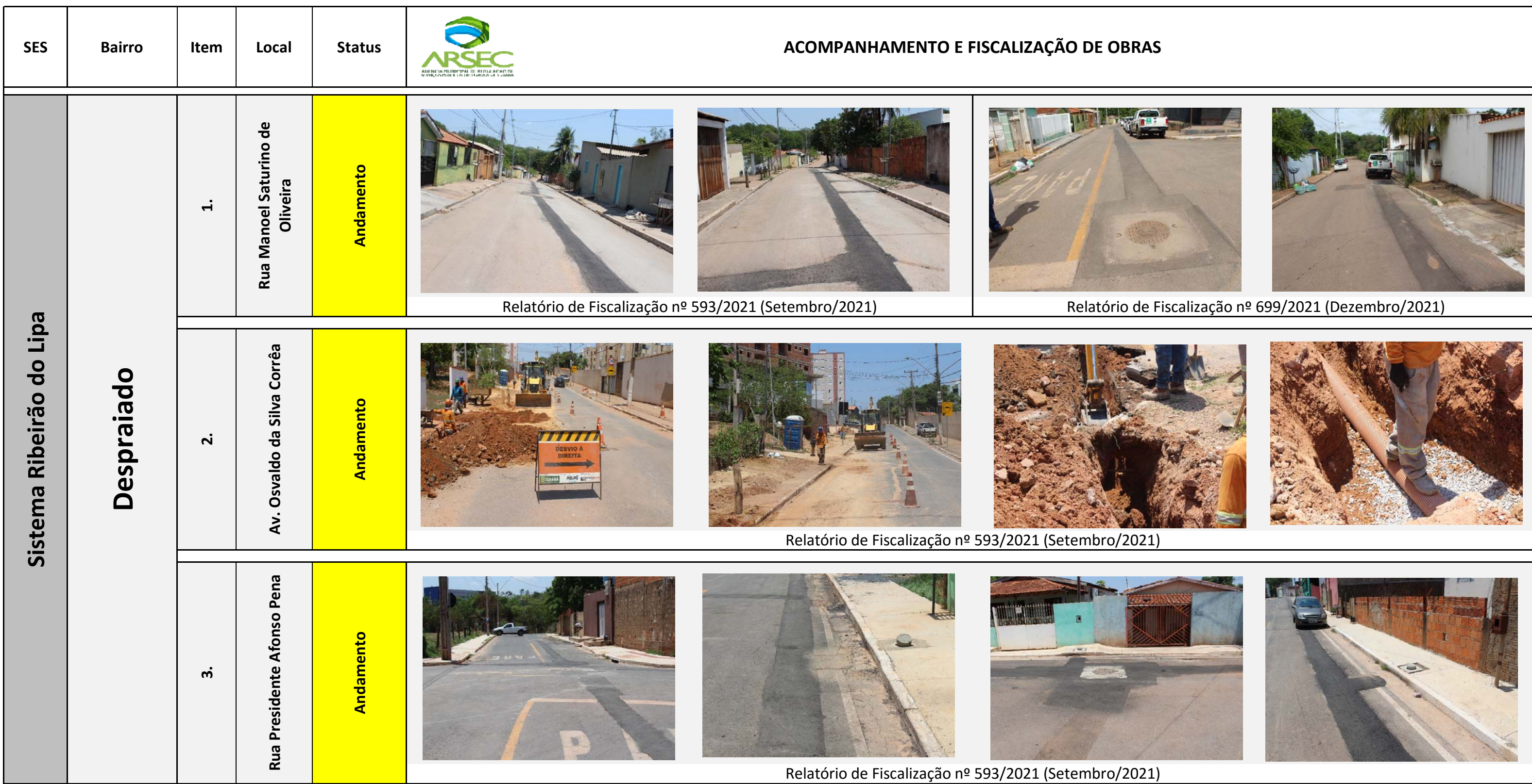
Relatório de Fiscalização nº 593/2021 (Setembro/2021)