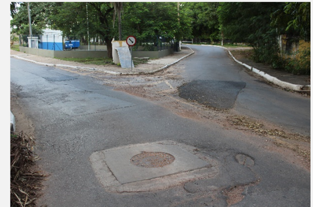
Relatório de Fiscalização 048/2022 (09/03/2022)