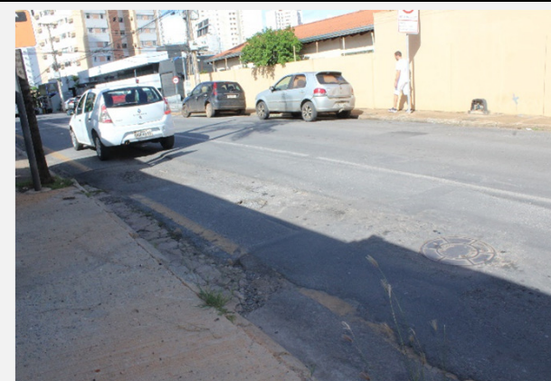
Relatório de Fiscalização 053/2022 (10/03/2022)