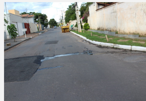
Relatório de Fiscalização 051/2022 (10/03/2022)