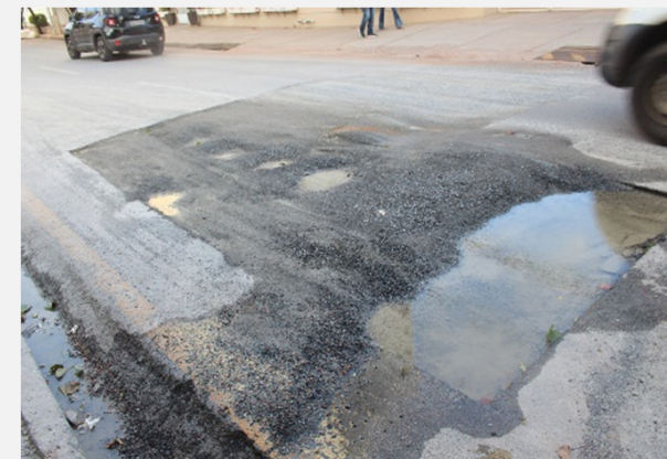
Relatório de Fiscalização 014/2022 (01/02/2022)