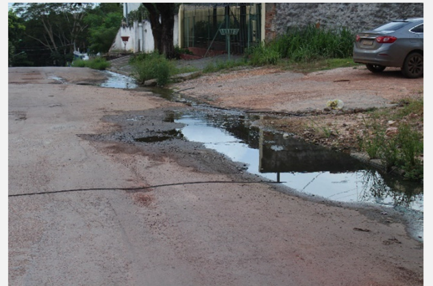
Relatório de Fiscalização 049-50/2022 (09/03/2022)