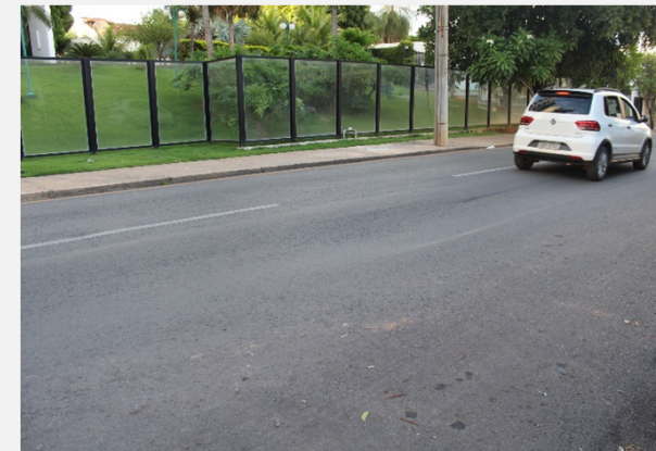
Relatório de Fiscalização 013/2022 (01/02/2022)