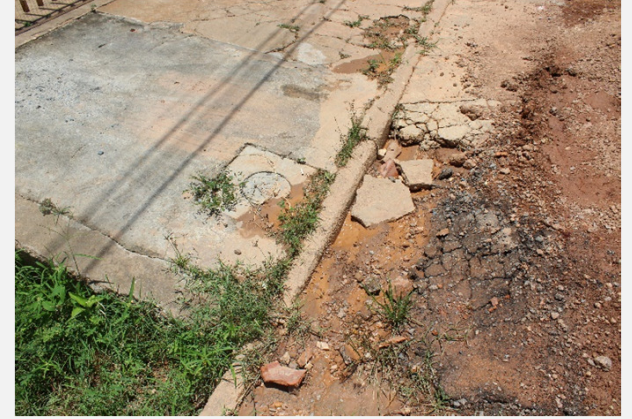
Relatório de Fiscalização 040/2022 (25/02/2022)