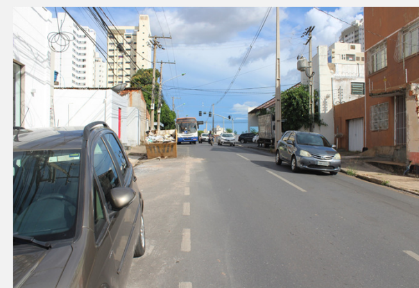
Relatório de Fiscalização 037/2022 (24/02/2022)